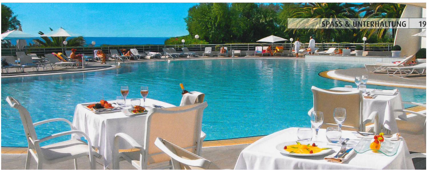
Wohltat für die Sinne: Blick auf die Restaurant-Terrasse des Hotels «Les Corallines» in La Grande Motte.