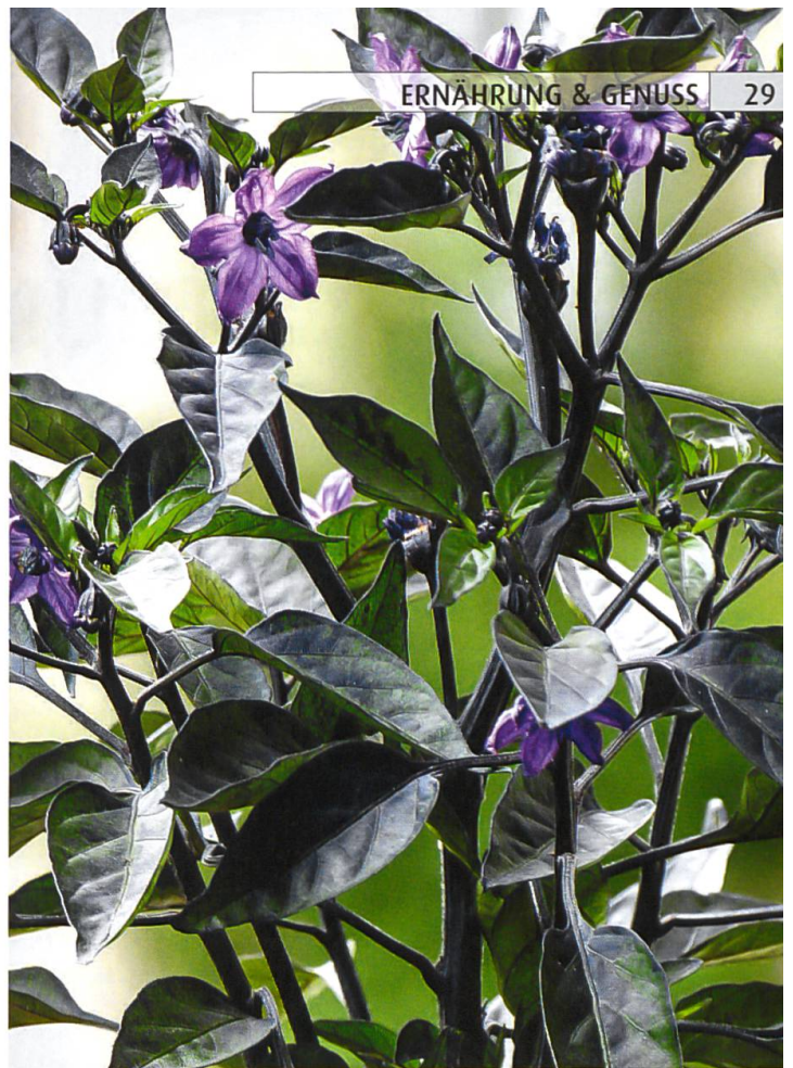
Zierpflanze: Die milde «Peruvian Purple» bietet hübsche violette Blüten, dunkelgrünes Laub und fast schwarze, aufrecht wachsende Früchte. Sie gedeiht auch in kühlerem Klima.

Schützen Chilis die Leber? Die Europäische Gesellschaft zur Erforschung der Leber EASL äusserte kürzlich die Vermutung, der tägliche Konsum von Capsaicin könne die Entstehung einer Leberzirrhose verhindern.