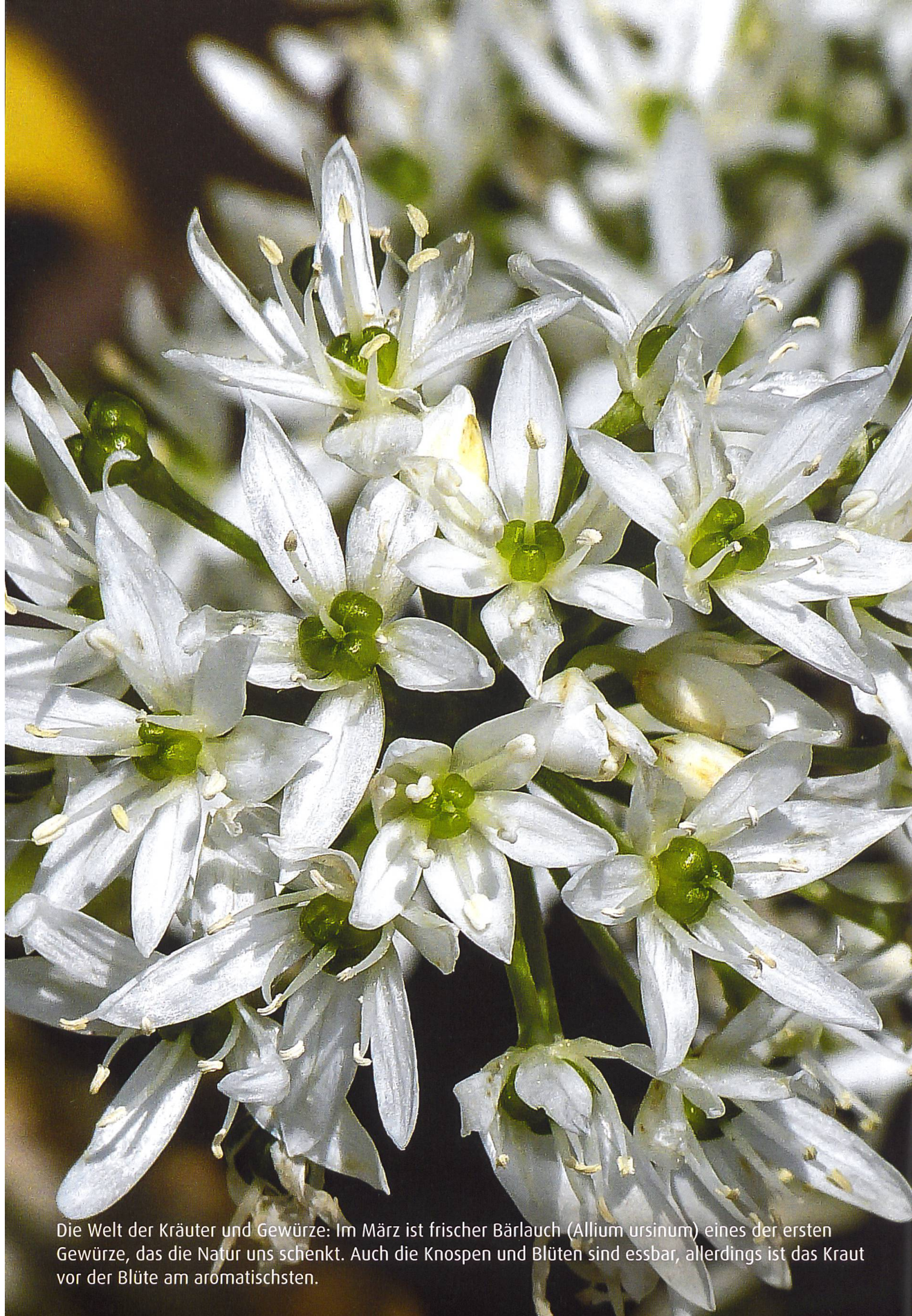
Die Welt der Kräuter und Gewürze: Im März ist frischer Bärlauch ( Allium ursinum ) eines der ersten Gewürze, das die Natur uns schenkt. Auch die Knospen und Blüten sind essbar, allerdings ist das Kraut vor der Blüte am aromatischsten.