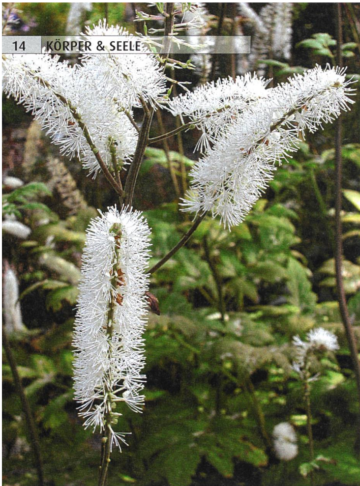
Heilpflanzen wie die Traubensilberkerze ( Cimicifuga racemosa , oben) und Salbei werden auch in der TCM eingesetzt.

nesischer Sicht. Es bedeutet nur, dass das Essen regelmässig einige nieren-tonisierende Nahrungsmittel enthalten sollte, am besten wechselnde.