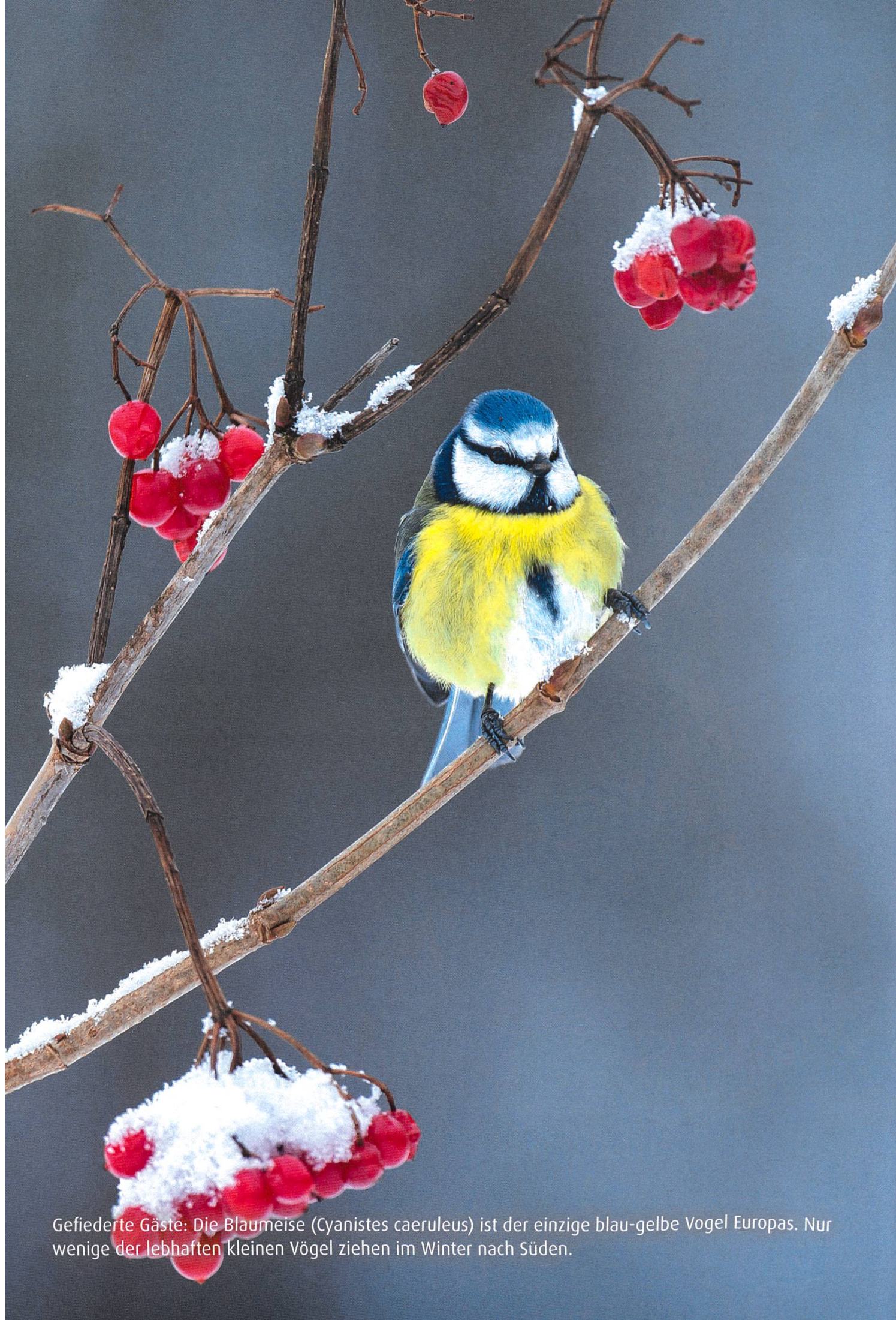
Gefiederte Gäste: Die Blaumeise ( Cyanistes caeruleus ) ist der einzige blau-gelbe Vogel Europas. Nur wenige der lebhaften kleinen Vögel ziehen im Winter nach Süden.