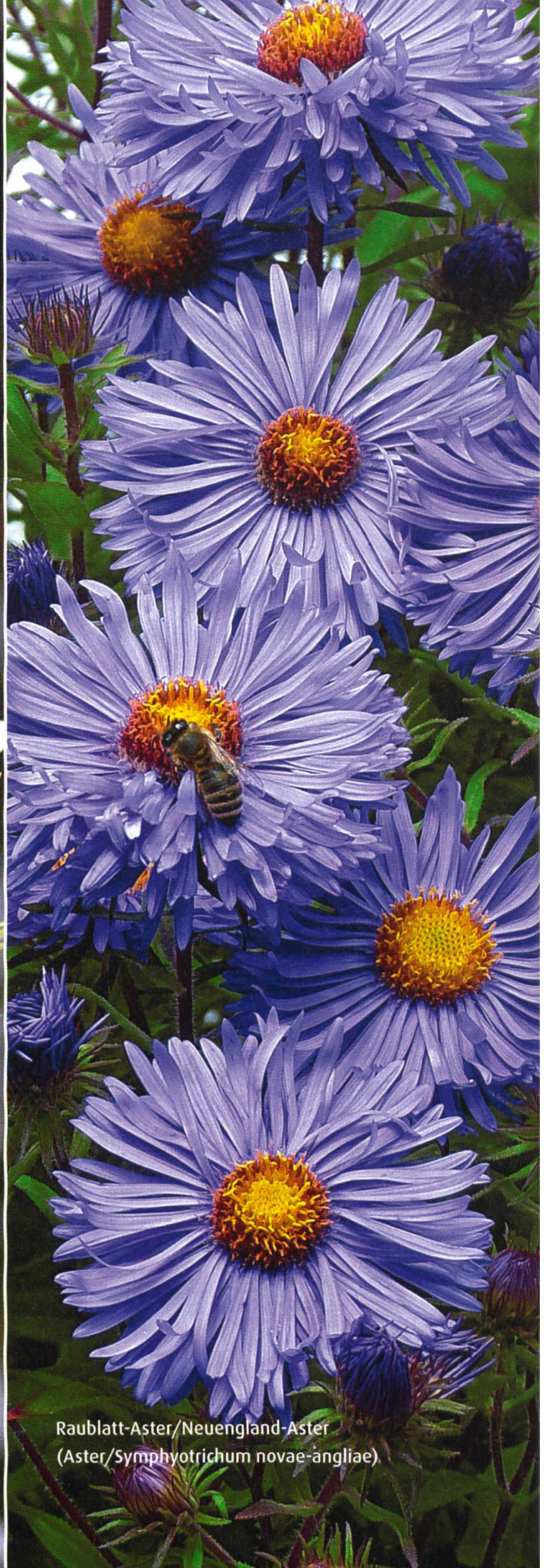
Raublatt-Aster/Neuengland-Aster ( Aster/Symphotrichum novae-angliae )