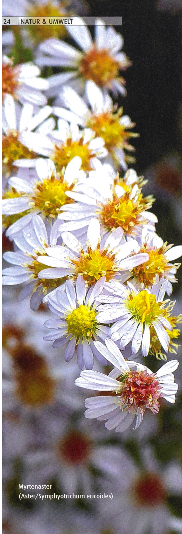
Myrtenaster ( Aster/Symphotrichum ericoides )