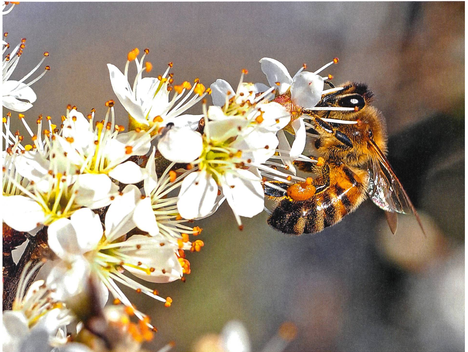
Biene beim Pollensammeln: Pestizide sind der Grund für das Bienensterben.

Wissenschaftler des EU-Wissenschaftsnetzwerks Easac konnten bestätigen, dass der Einsatz bestimmter Pestizide für das Bienensterben verantwortlich ist. Die sogenannten Neonicotinoid-Insektizide werden überwiegend von Bayer aus Leverkusen und Syngenta aus der Schweiz produziert und in mehr als 120 Ländern eingesetzt. Den Forschern zufolge sind aber nicht nur Honigbie-