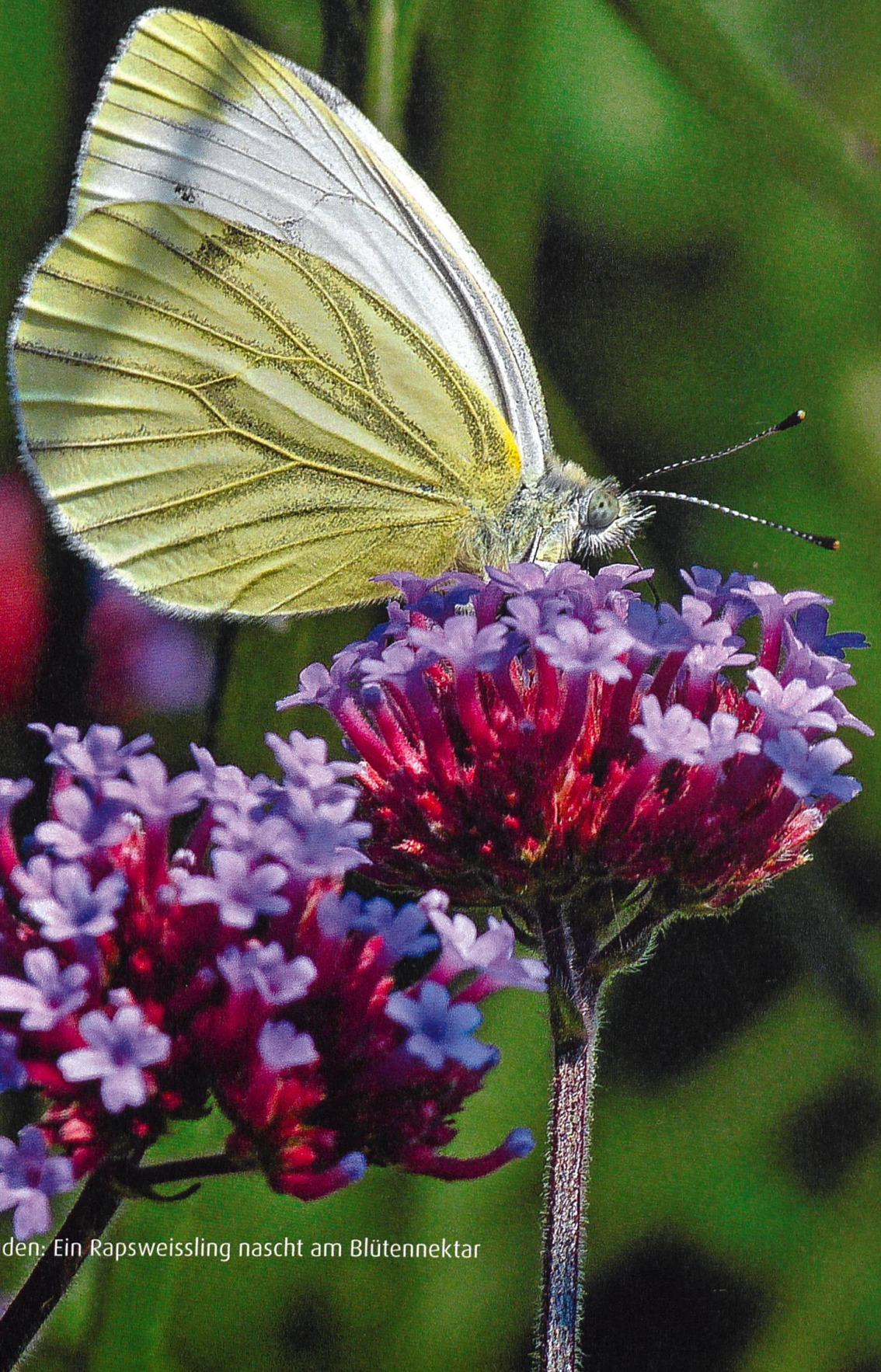
Sommerfreuden: Ein Rapsweissling nascht am Blütennektar