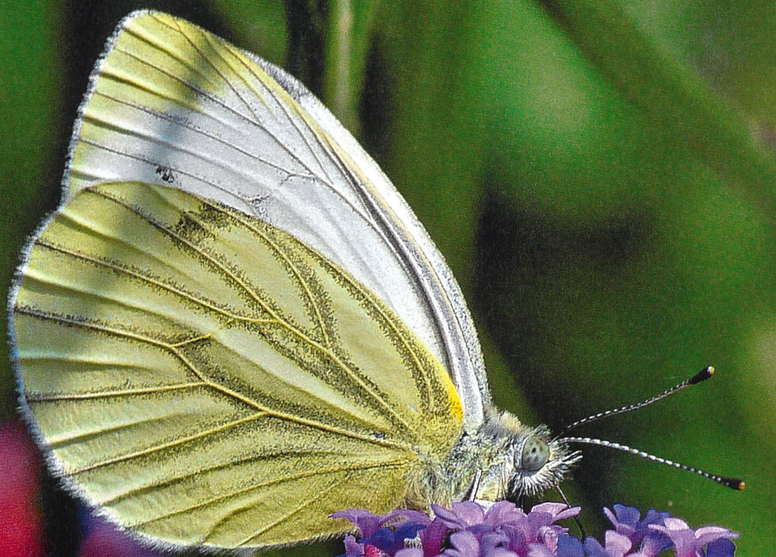
Sommerfreuden: Ein Rapsweissling nascht am Blütennektar