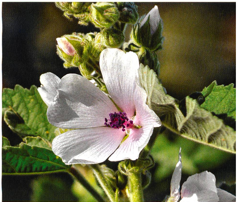
Königskerze (links) und Eibisch gehören zu den wichtigsten pflanzlichen Helfern bei Husten.

Reizhusten sogar schädlich für die Schleimhäute ist, ist das auch medizinisch sinnvoll. Schnelle und wirksame Erleichterung für die wundete Kehle bringen Haus- und pflanzliche Heilmittel.