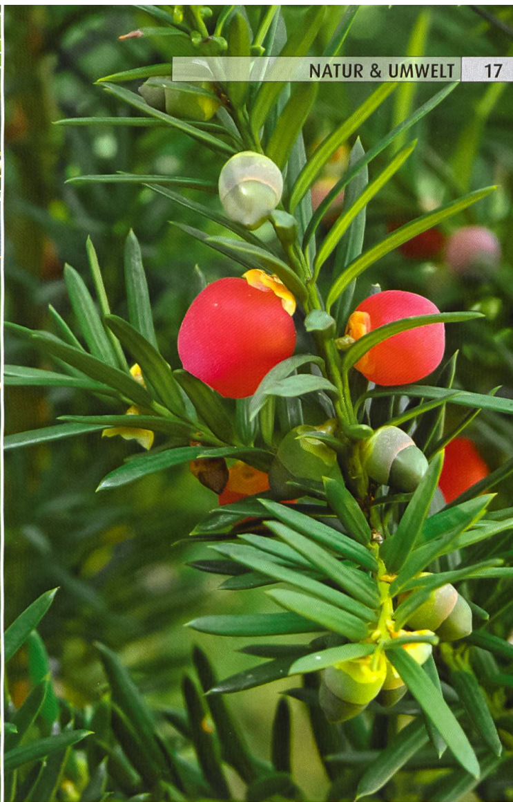
Eibe – süss die herbstlichen Beeren, giftig die Samen darin.

Obwohl tödliche Vergiftungen bei Kindern selten sind, da alle Pflanzenteile recht bitter schmecken, wird Familien mit kleinen Kindern geraten, die Pflanze aus dem Garten zu verbannen.