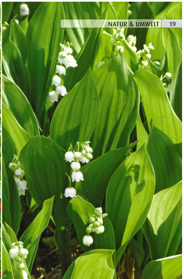
Maiglöckchen – lieblich duftend, trotz starkem Gift.

Im Garten erreicht der überaus dekorative Wunderbaum ( Rizinus communis ) in einem warmen Jahr schnell eine Höhe von gut drei Metern. Nach der Blüte entwickeln sich weich behaarte, rote Kapseln, in denen die hübsch marmorierten Samen (kleines Bild) sitzen. Sie sind ca. 12 Millimeter gross und enthalten u.a. das Protein Ricin, eine der giftigsten Eiweiss-Substanzen im Pflanzenreich. Die harten, gut schmeckenden Samen sollten keinesfalls in Kinderhände geraten. Die Giftwirkung ist abhängig vom Zerkauen, unter Umständen reicht schon ein zerkauter Same als tödliche Dosis. Eine Vergiftung beginnt mit Brennen im Mund, Übelkeit, Durchfällen und Schwindel. Es folgen Darmkrämpfe, Nieren- und Leberentzündung. Der Tod tritt nach zwei oder mehr Tagen durch Kreislaufversagen ein. Eine Gefahr für Kinder sind auch Ketten aus durchbohrten Rizinussamen (Castorbohnen), die auf ausländischen Märkten verkauft werden. Das Gift kann durch kleine Hautverletzungen dringen.