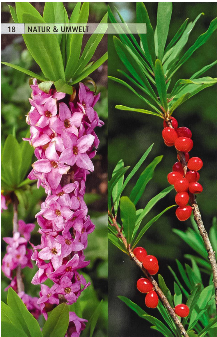
Seidelbast – im Wald selten geworden, im Garten beliebt.