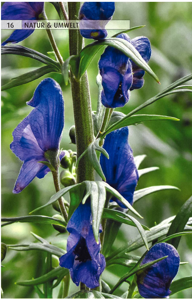
Der Blaue Eisenhut – bitte nicht berühren!