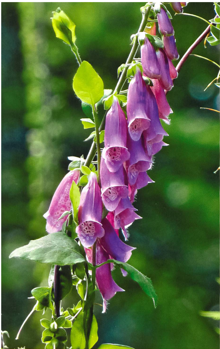
Roter Fingerhut – er gehört nicht in Gärten mit Kindern.