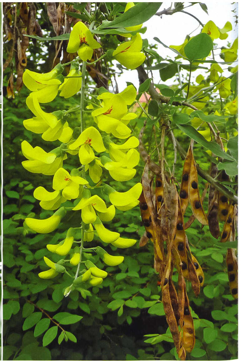
Gemeiner Goldregen – giftig für Menschen und Tiere.

Die blaublütige Zierpflanze, die man nicht nur in Bauerngärten häufig sieht, blüht zwischen Juni und August. Sie hat es in sich: eines der gefährlichsten Pflanzengifte Europas. Alle Pflanzenteile und besonders die Wurzel sind reich an Aconitin, einem Herz- und Nervengift, das noch stärker wirkt als Strychnin. Geschluckt sind bereits kleinste Mengen bedrohlich, die tödliche Dosis für einen Erwachsenen liegt bei zirka fünf Milligramm. Nach dem Verzehr kommt es zu Kribbeln und Taubheit im Mund, an Zunge und Händen, heftigem Erbrechen, Darmkoliken, Schwindel, Herzrasen bis hin zum Tod durch Atemlähmung. Doch das Gift des Blauen Eisenhuts ( Aconitum napellus ) dringt schon bei Berührung selbst durch die intakte Haut. Typisches Symptom ist eine Taubheit der entsprechenden Körperstelle. Dringt Pflanzensaft in eine Wunde, kann es nicht nur zu schmerzenden Gliedmassen, sondern auch zu Erstickungsgefühlen und Kreislaufkollaps kommen.