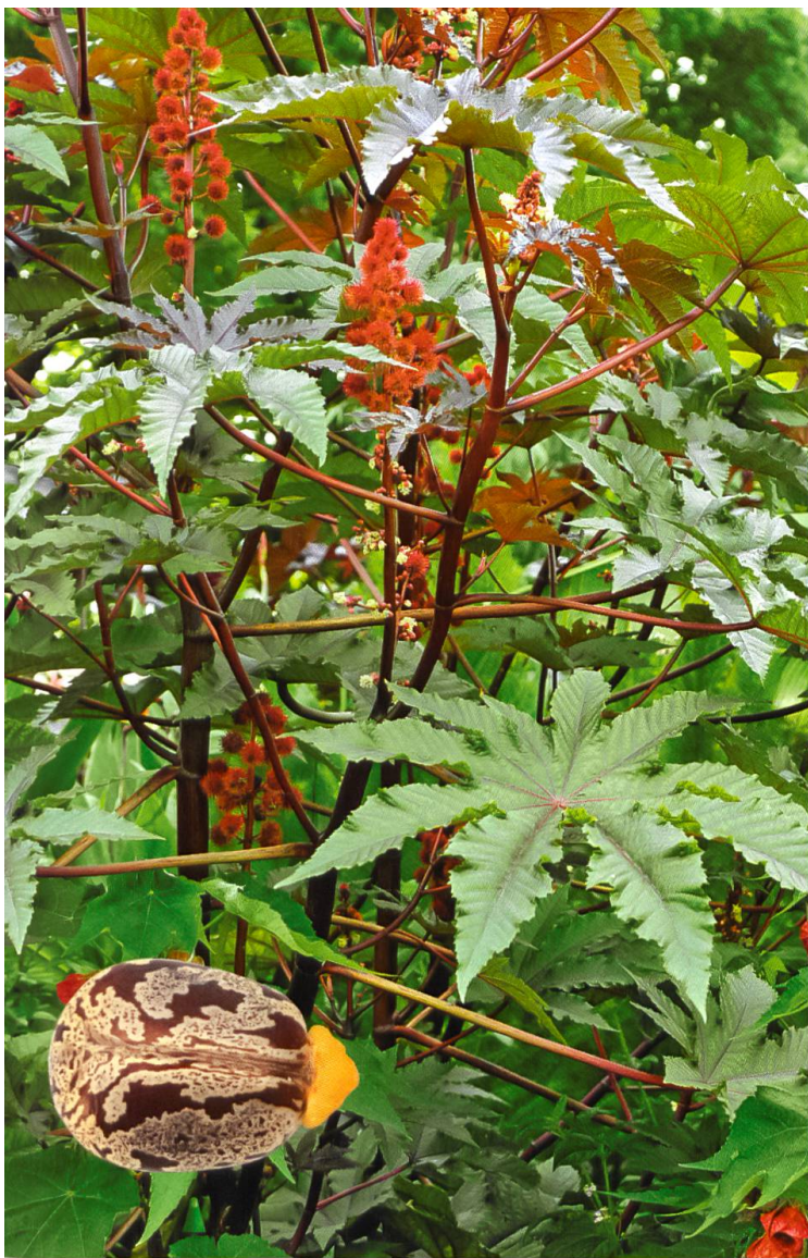
Rizinus oder Wunderbaum – Vorsicht mit den Samen.