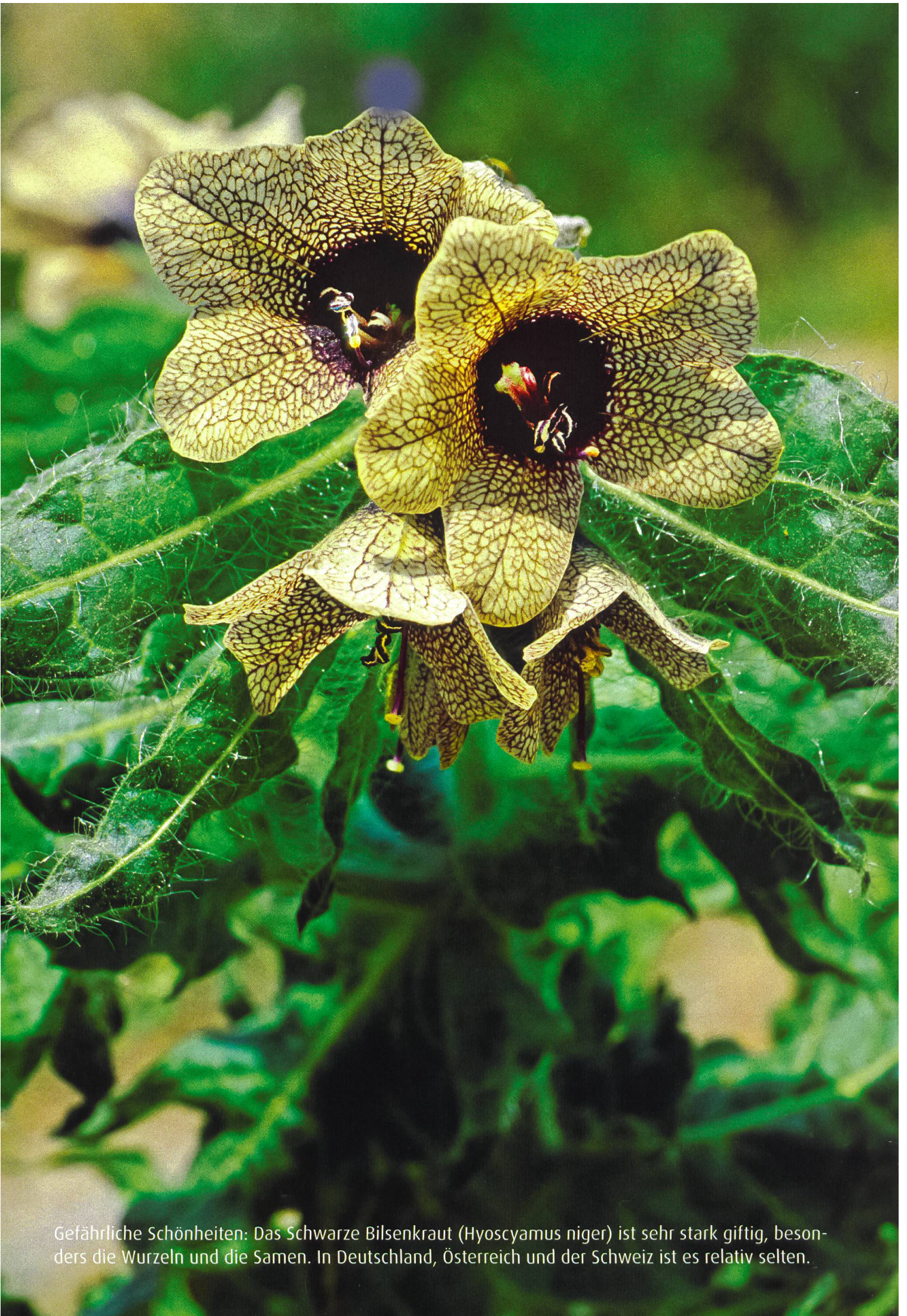
Gefährliche Schönheiten: Das Schwarze Bilsenkraut ( Hyoscyamus niger ) ist sehr stark giftig, besonders die Wurzeln und die Samen. In Deutschland, Österreich und der Schweiz ist es relativ selten.