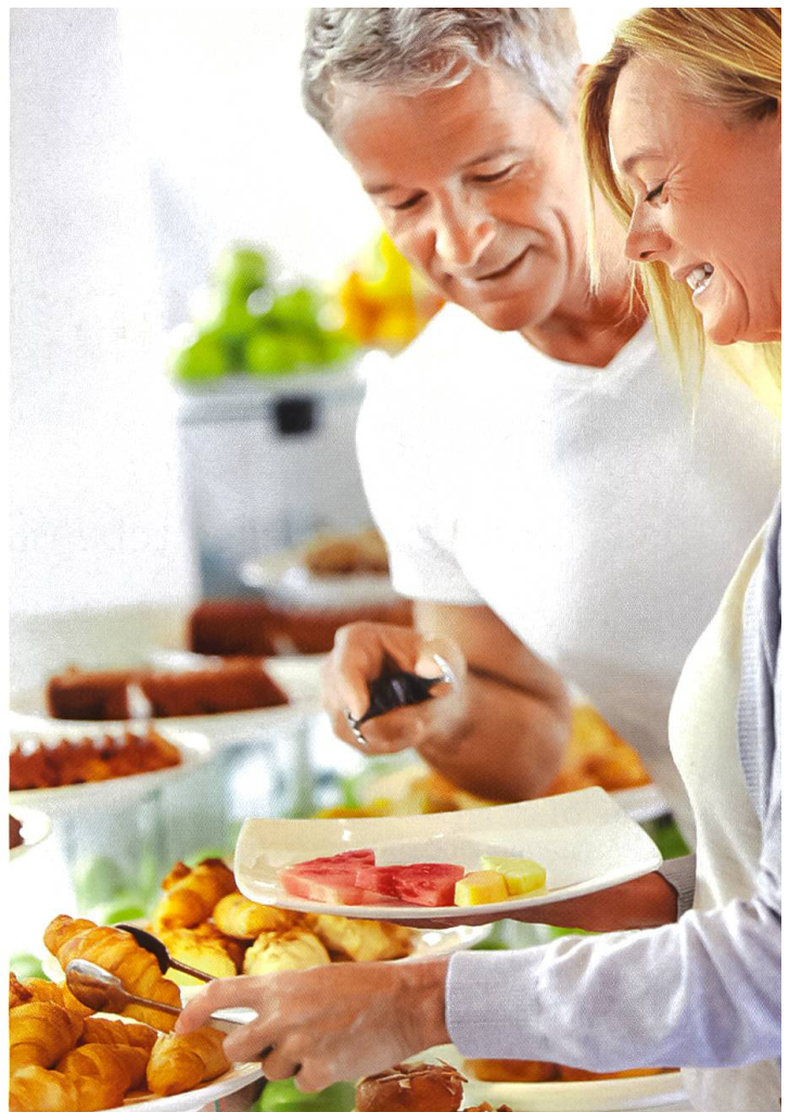
Bitte zugreifen: Mundgerechte Happen, appetitlich angerichtet.

Doch selbst die gehobene Bevölkerungsschicht machte wenig Aufwand zu Tisch und ass ebenso von Hand wie alle anderen auch. Besonders die Gabel war verpönt: Der Dreizack war ein Hexenwerkzeug des Teufels. Die berühmte Heilerin und Mystikerin Hildegard von Bingen verurteilte das Essen mit der Gabel statt mit den eigenen Fingern scharf.