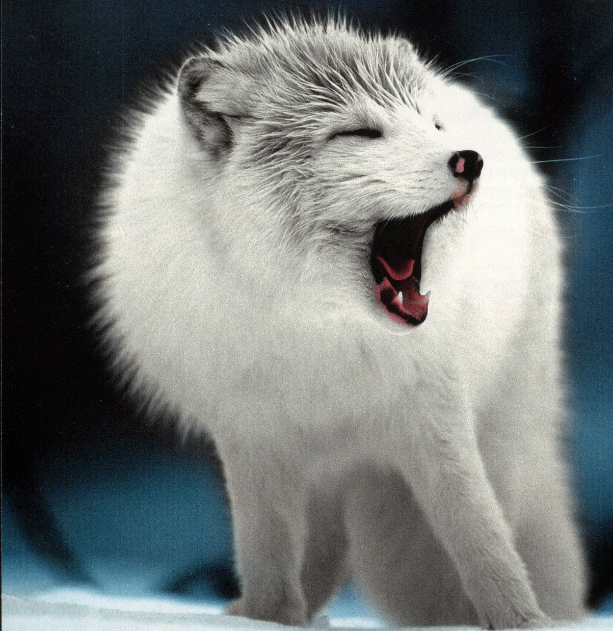
Polarfuchs ( Vulpes lagopus ): Frühjahrsmüde