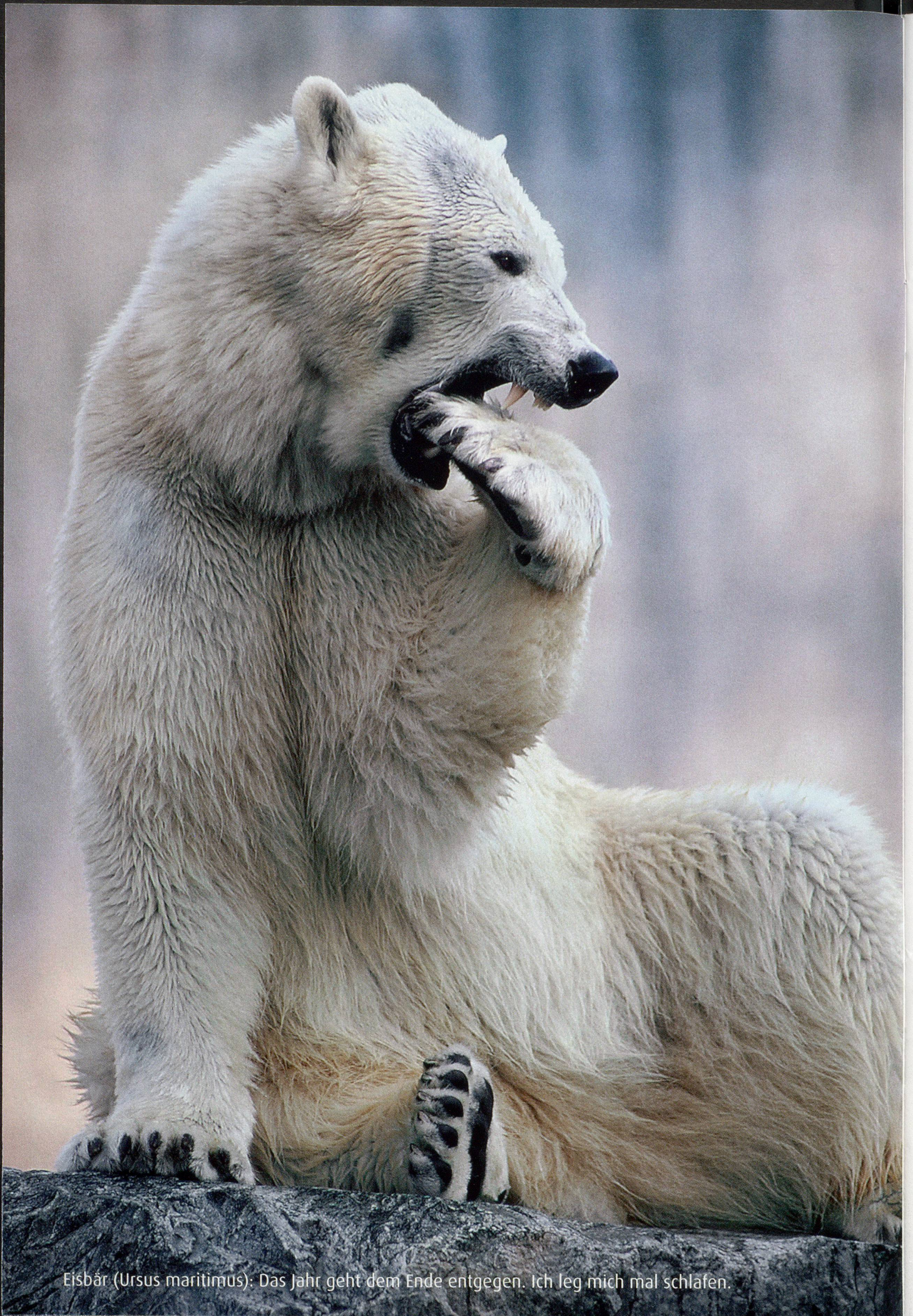
Eisbär ( Ursus maritimus ): Das Jahr geht dem Ende entgegen. Ich leg mich mal schlafen.