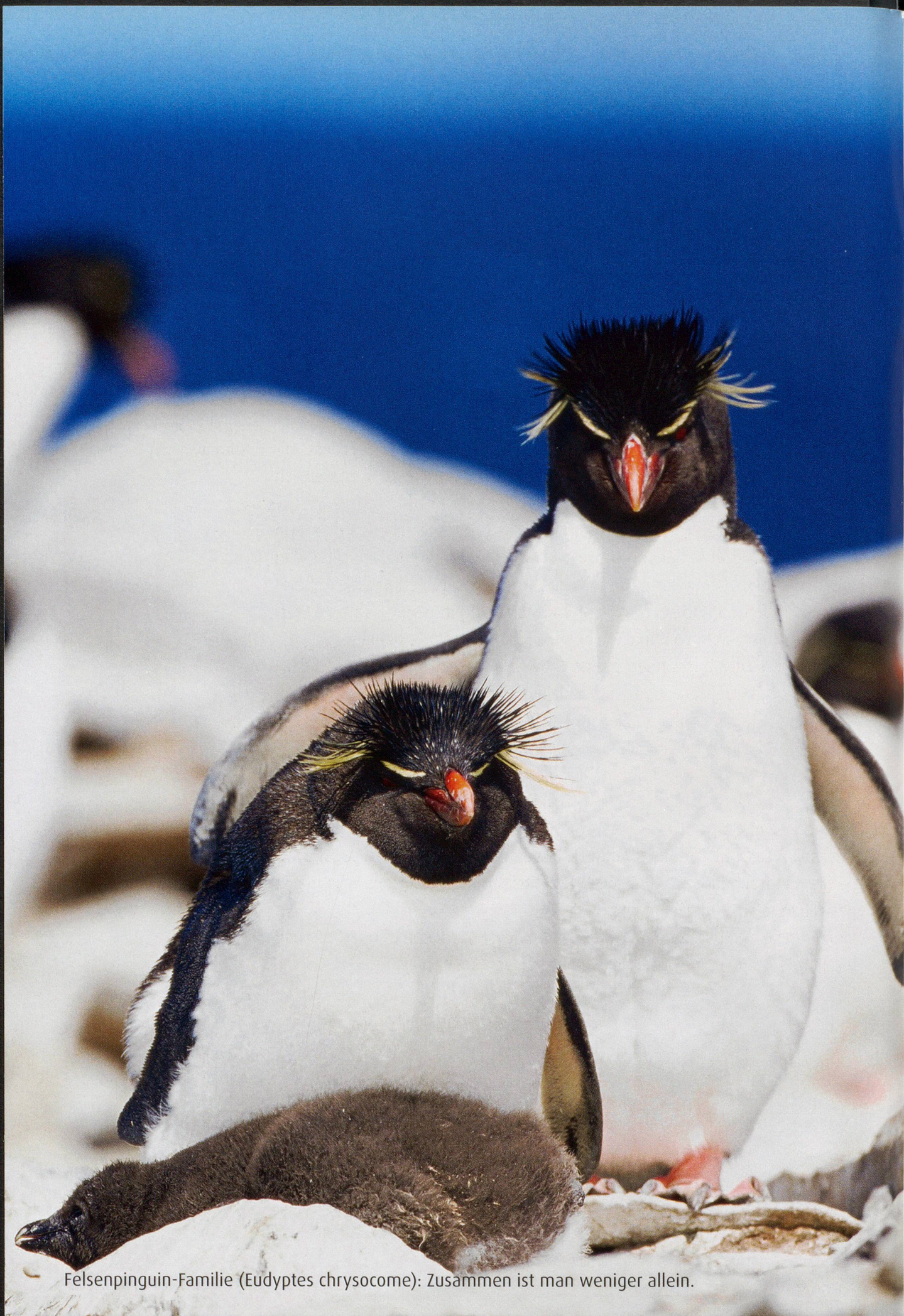
Felsenpinguin-Familie ( Eudyptes chrysocome ): Zusammen ist man weniger allein.