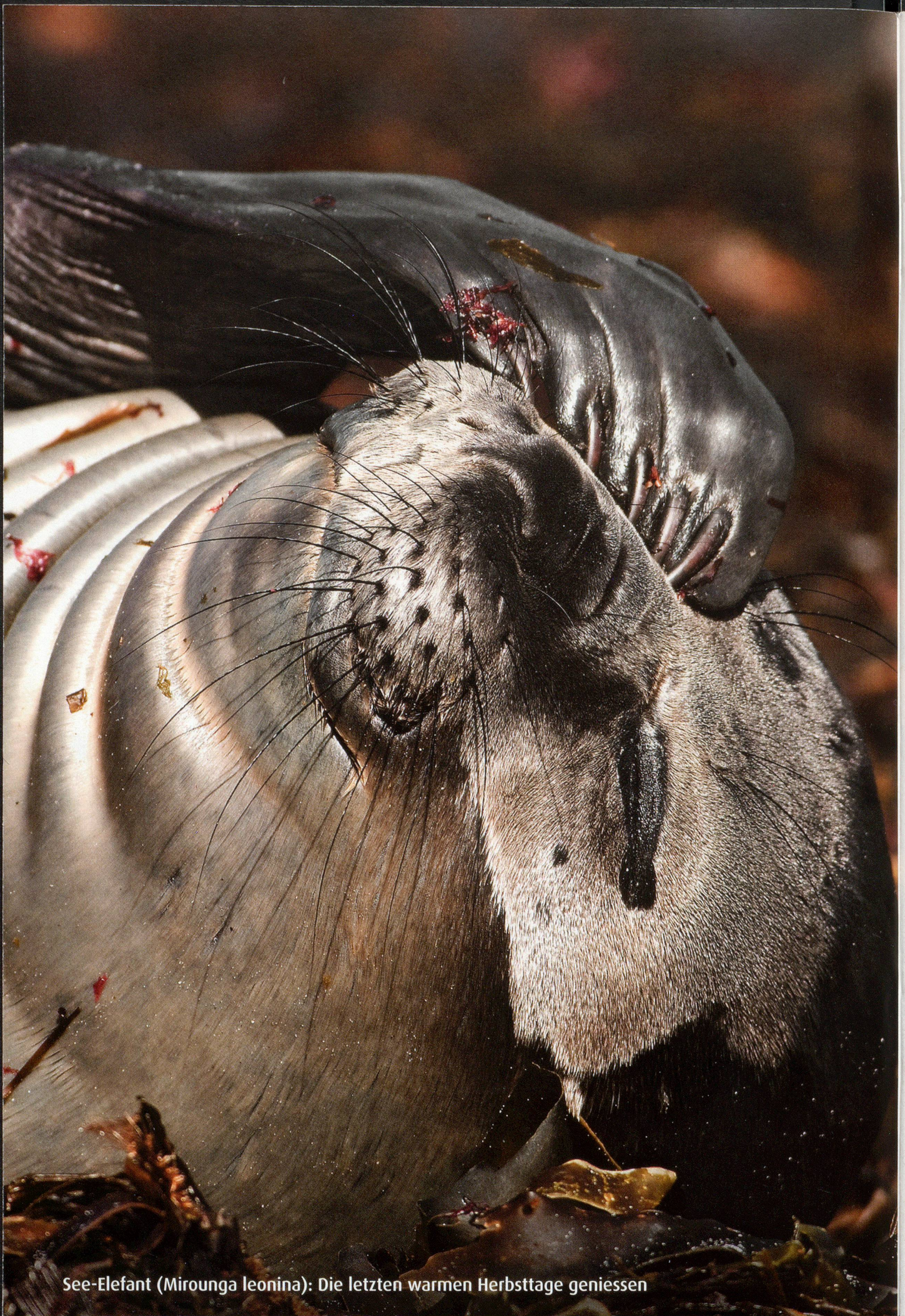
See-Elefant ( Mirounga leonina ): Die letzten warmen Herbsttage genießen