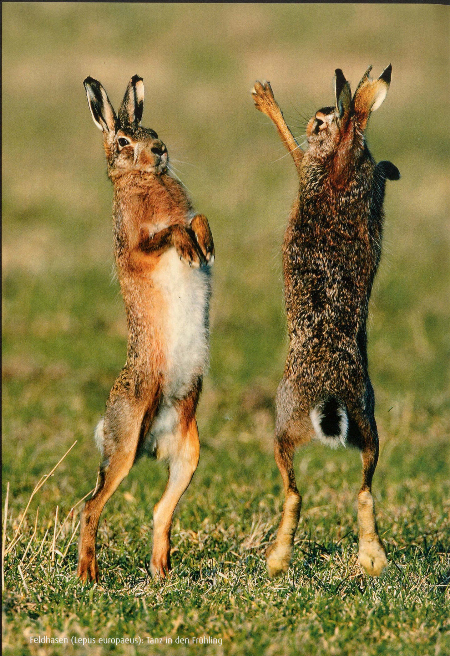
Feldhasen ( Lepus europaeus ): Tanz in den Frühling