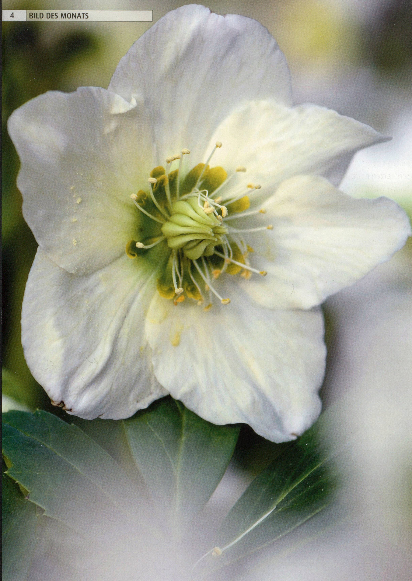
Gartenschönheit Schneerose ( Helleborus niger )