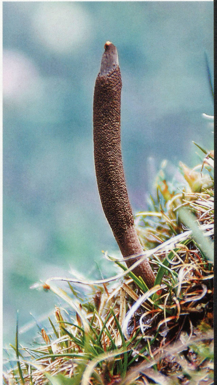
Der Tibetische oder Chinesische Raupenpilz wächst im Himalaya in etwa 3000 bis 5000 Meter Höhe.

Schmetterlingsweibchen der Gattung Thitarodes , die ebenfalls nur in Tibet vorkommt, Wurzelbohrer oder Geistermotten genannt, legen zahlreiche Eier auf den Bergwiesen ab. Die daraus schlüpfenden Raupen bohren sich in den Boden und fressen an Pflanzenwurzeln. Die Sporen des parasitischen Pilzes befallen die Larven, und das Pilzgeflecht ernährt sich von ihrem Gewebe, bis der gesamte Körper der Raupe von seinen feinen Fäden ausgefüllt ist.