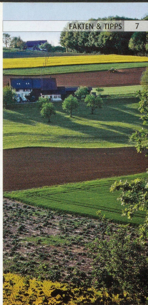
Biologisch bewirtschaftete Bauernhöfe tragen auf vielfältige Weise zum Schutz der Umwelt und des Klimas bei.