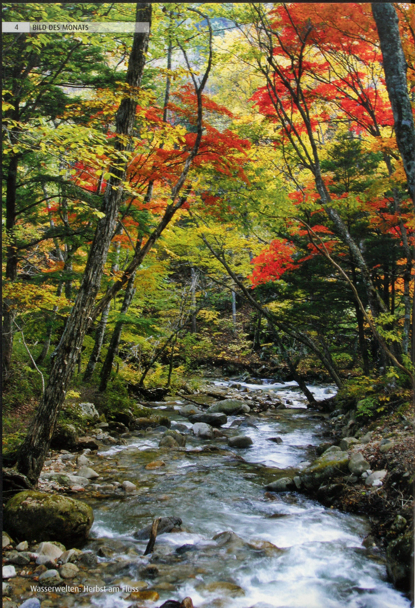
Wasserwelten: Herbst am Fluss