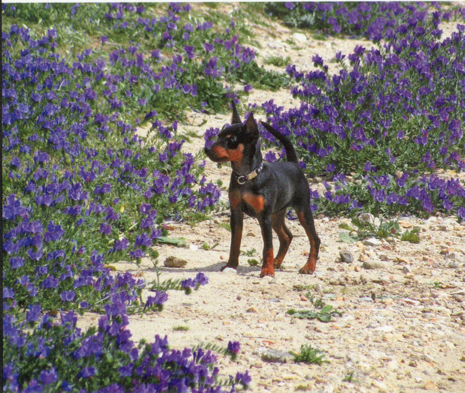
Leserforum-Galerie «Haustiere»: Hundeferien 1: Sonja Ungers «Wichita» spielt in Spanien das Blumenkind.