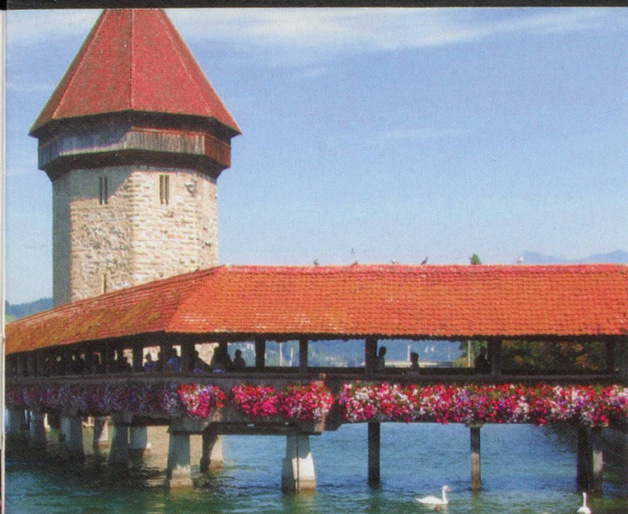
Ansicht aus einer der gesuchten Schweizer Städte.