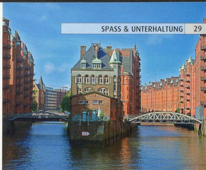
Ansicht aus einer der gesuchten deutschen Städte.