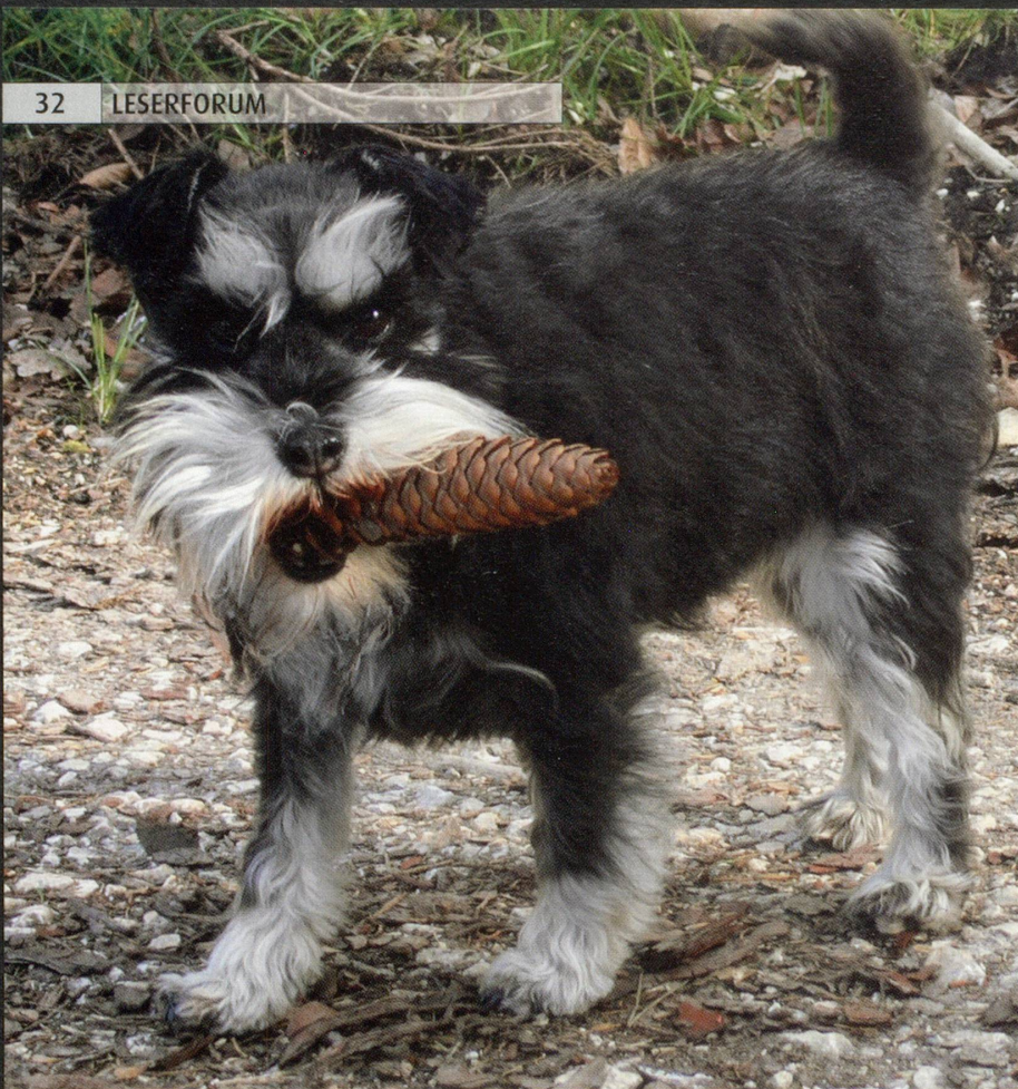
Leserforum-Galerie «Haustiere»: Sieht sie nicht wirklich aus, als ob sie den Tannenzapfen rauchen wolle? «Sally mit Havanna» nennt Ria Gratz ihr drolliges Bild.