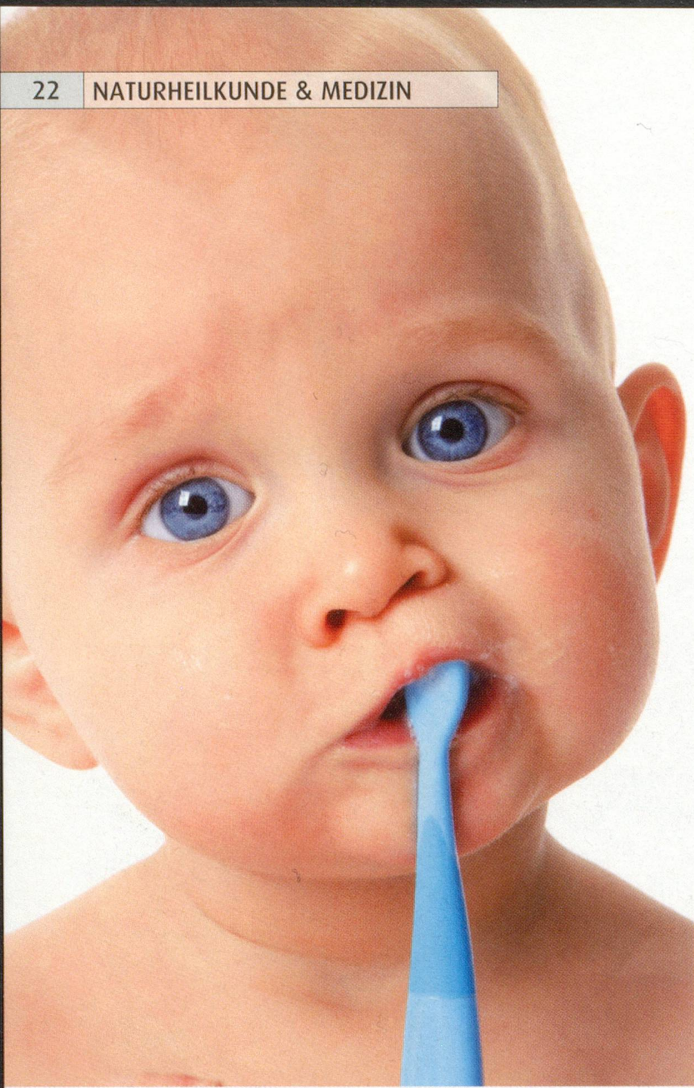
Schon die Kleinsten sollten es lernen: richtig Zähneputzen.