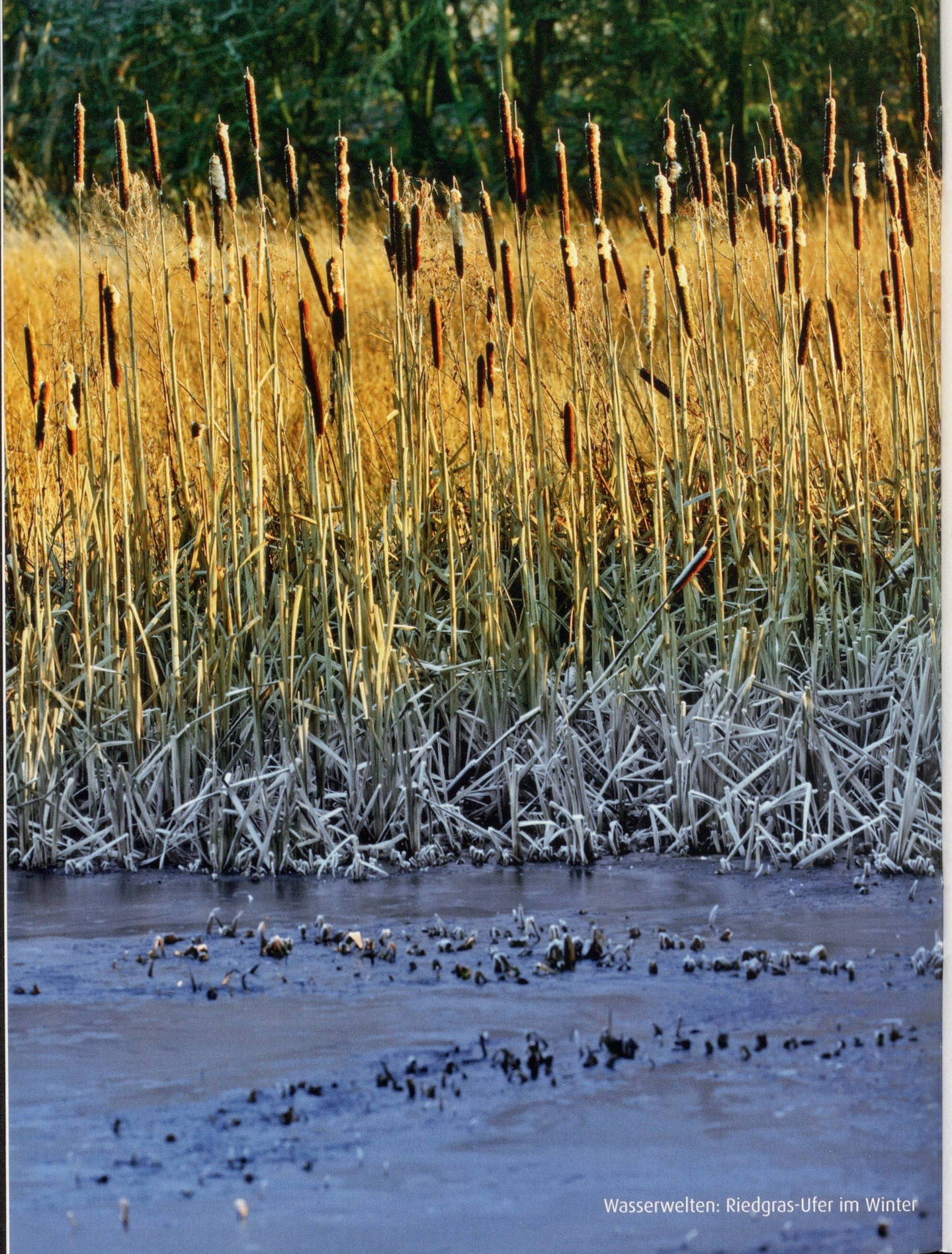
Wasserwelten: Riedgras-Ufer im Winter