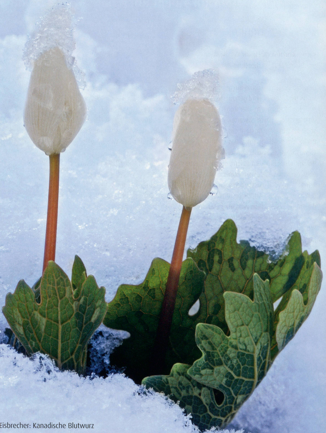
Eisbrecher: Kanadische Blutwurz