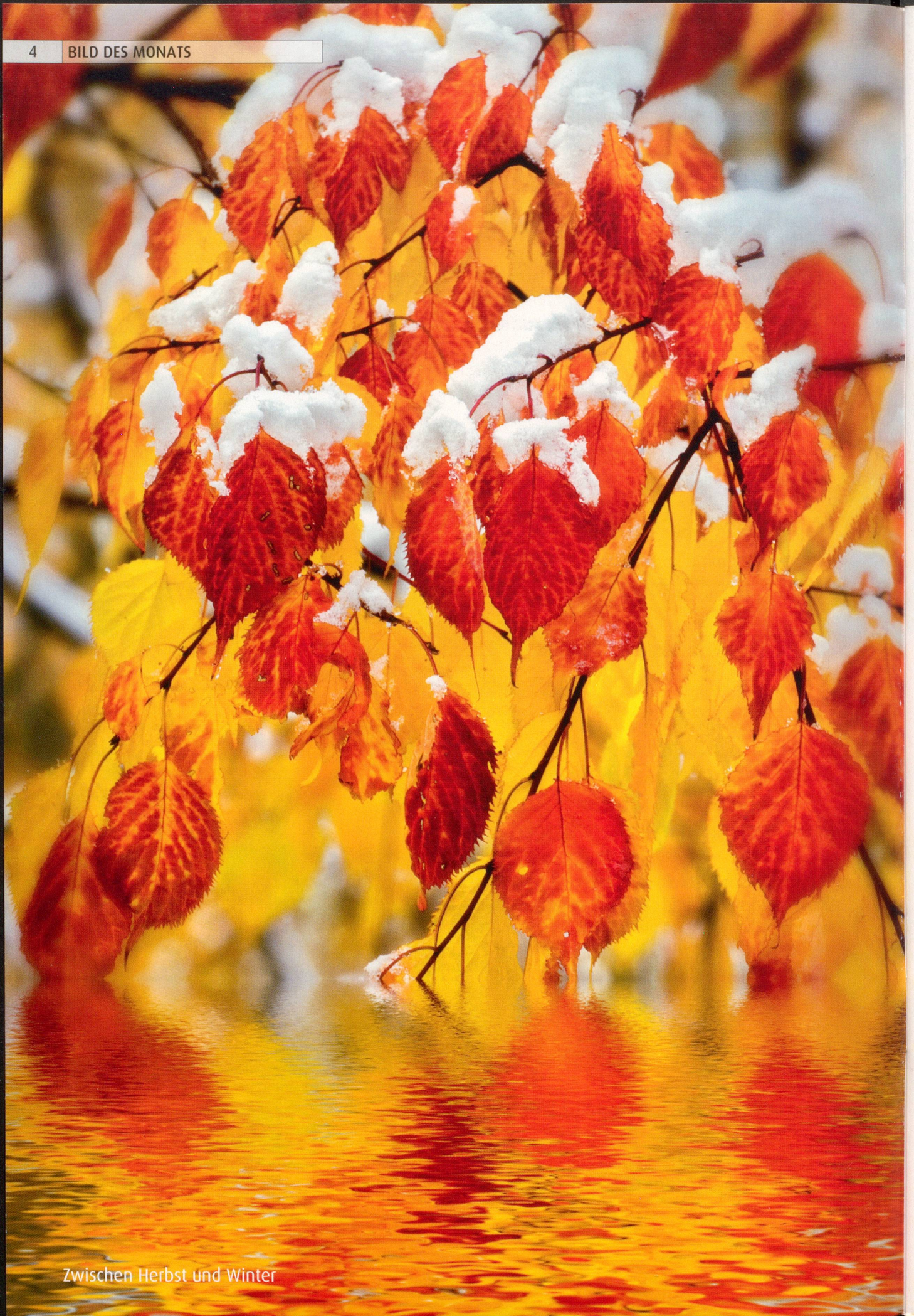
Zwischen Herbst und Winter