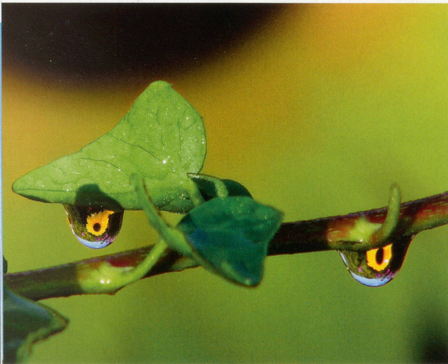
Leserforum-Galerie «Der Garten rund ums Jahr»: Die ganze Gartenwelt in zwei kleinen Wassertropfen fing Leser Beat Hopfengärtner ein.

Darmprobleme, Angst und Panikstörungen, Depressionen, allesamt ausgelöst durch seelischen Stress und Traumata, sind weg und geheilt.