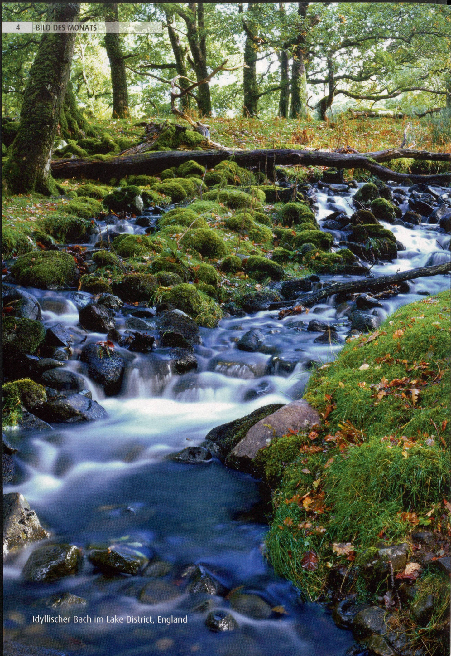
Idyllischer Bach im Lake District, England