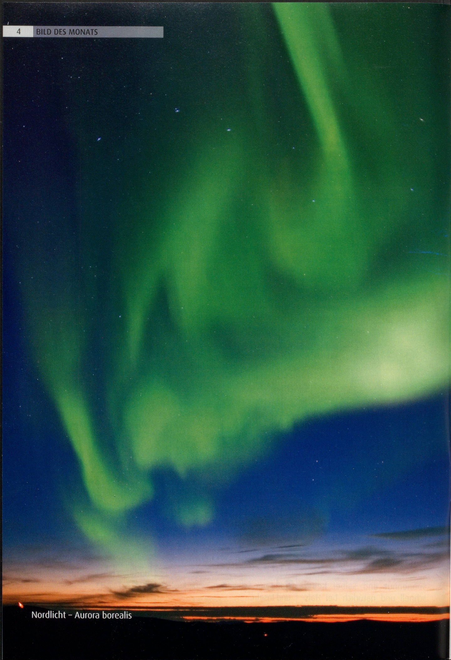
Nordlicht – Aurora borealis