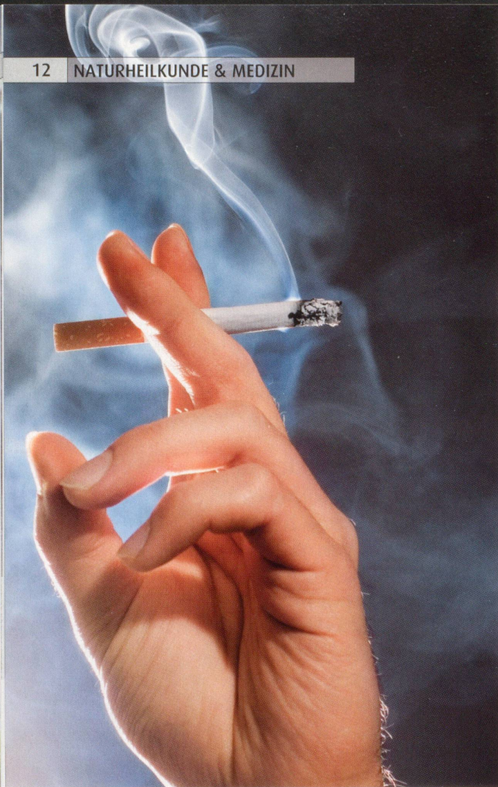
Hauptursache: Der gefährliche blaue Dunst

Prozent aller Menschen, die an COPD leiden, sind oder waren Raucher, auch wenn umgekehrt nicht alle Raucher die fortschreitende Lungenkrankheit bekommen.