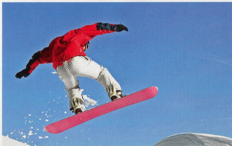
Vielfältig, spannend, international: Die Sporterlebnisse der GN-Leser.