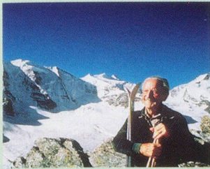
Alfred Vogel (1902 – 1996)