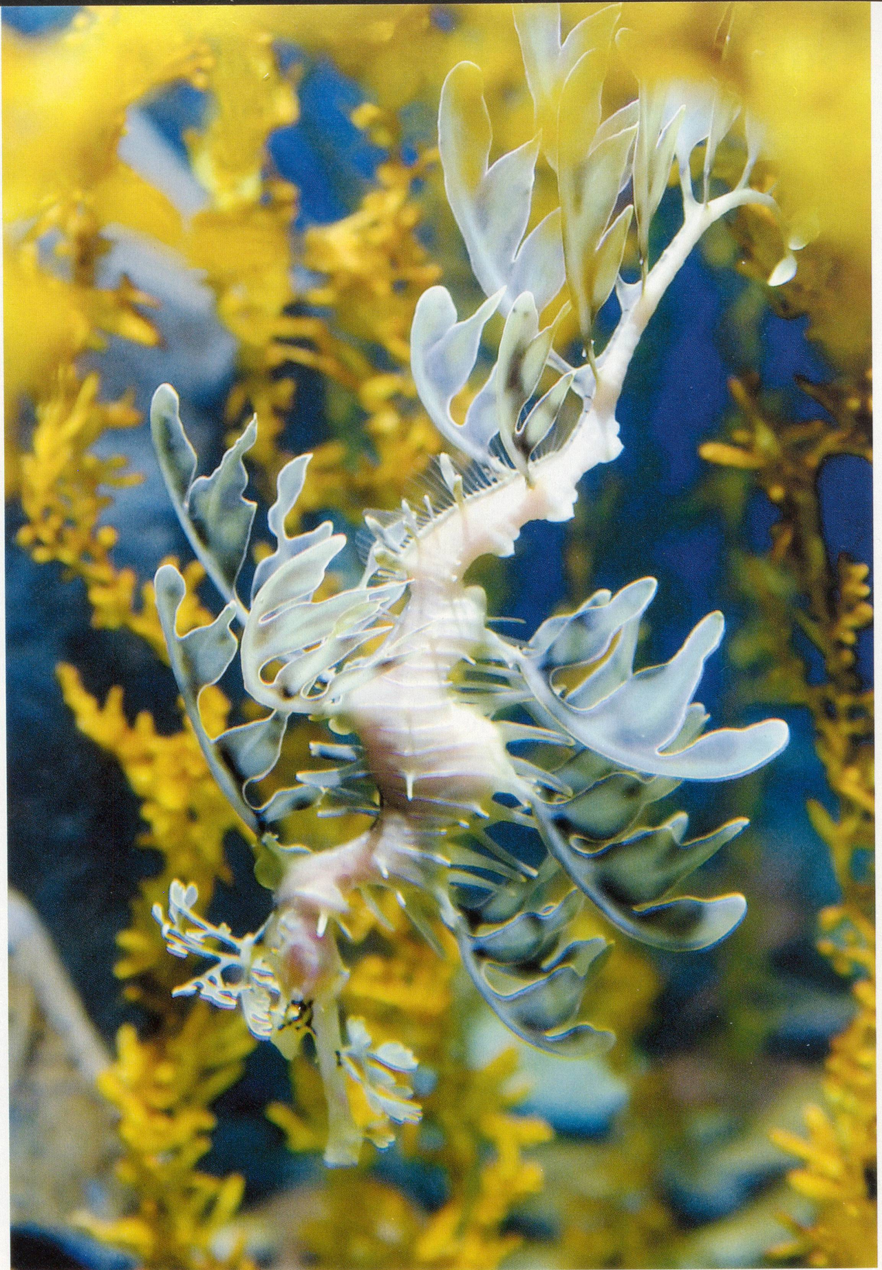
Bild des Monats: Geschöpf des Meeres – der bizarre Fetzenfisch ist ein Verwandter des Seepferdchens, der vor den Küsten Australiens lebt.