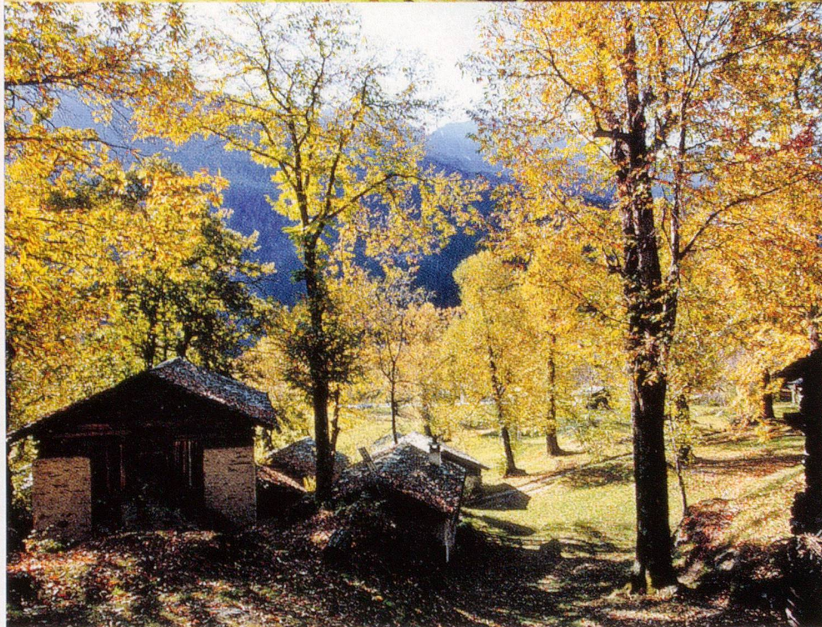
Die stachelig bepelzten Hüllen der Edelkastanie ( Castanea sativa ) bergen die edlen Nussfrüchte. Aus Soglio, einem kleinen Ort im Bergelltal (Kanton Graubünden) kommen die berühmtesten Maroni. Schon der Dichter Rainer Maria Rilke bewunderte hier «die Herrlichkeit des Kastanienwalds».

Stärke wie die Kartoffel. Die Kastanie wurde früher oft zu Mehl verarbeitet, mit dem Mehl Brot gebacken.