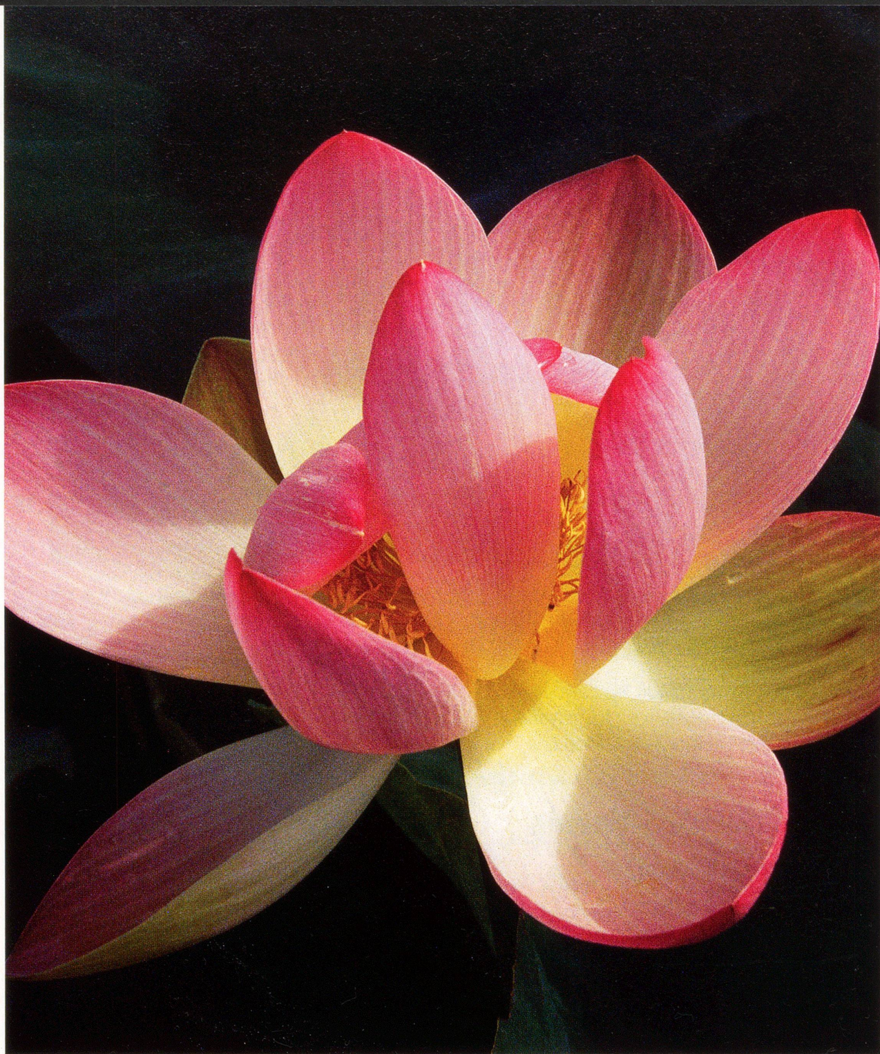
Bild des Monats – Ganz nah: Indische Lotusblume ( Nelumbo nucifera )