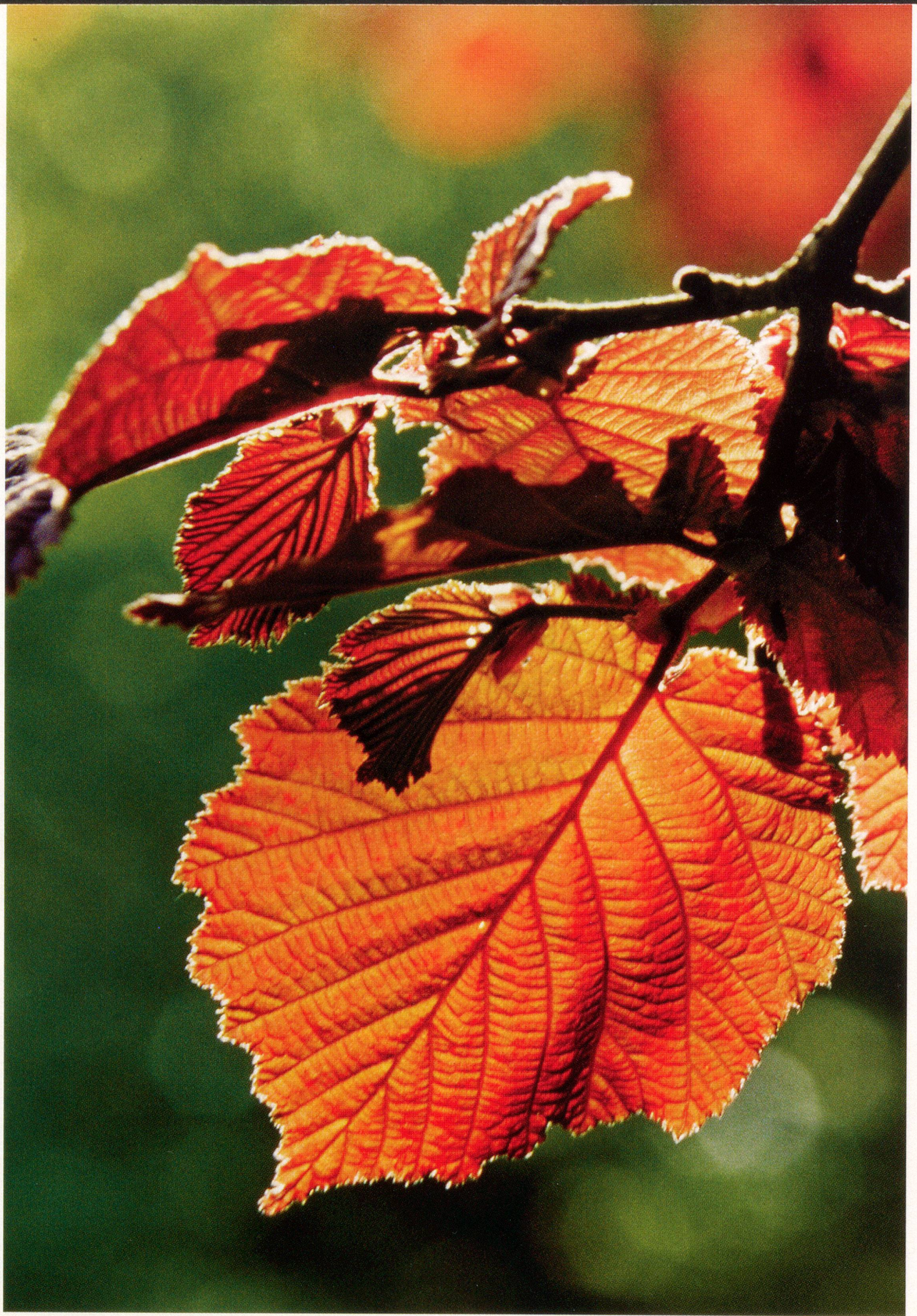
Bild des Monats – Ganz nah: Der Haselstrauch ( Corylus avellana )