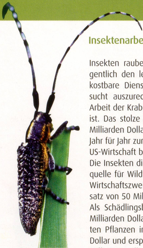
Bockkäfer, Libelle und Co. – fleissige Arbeiter für unsere Umwelt.