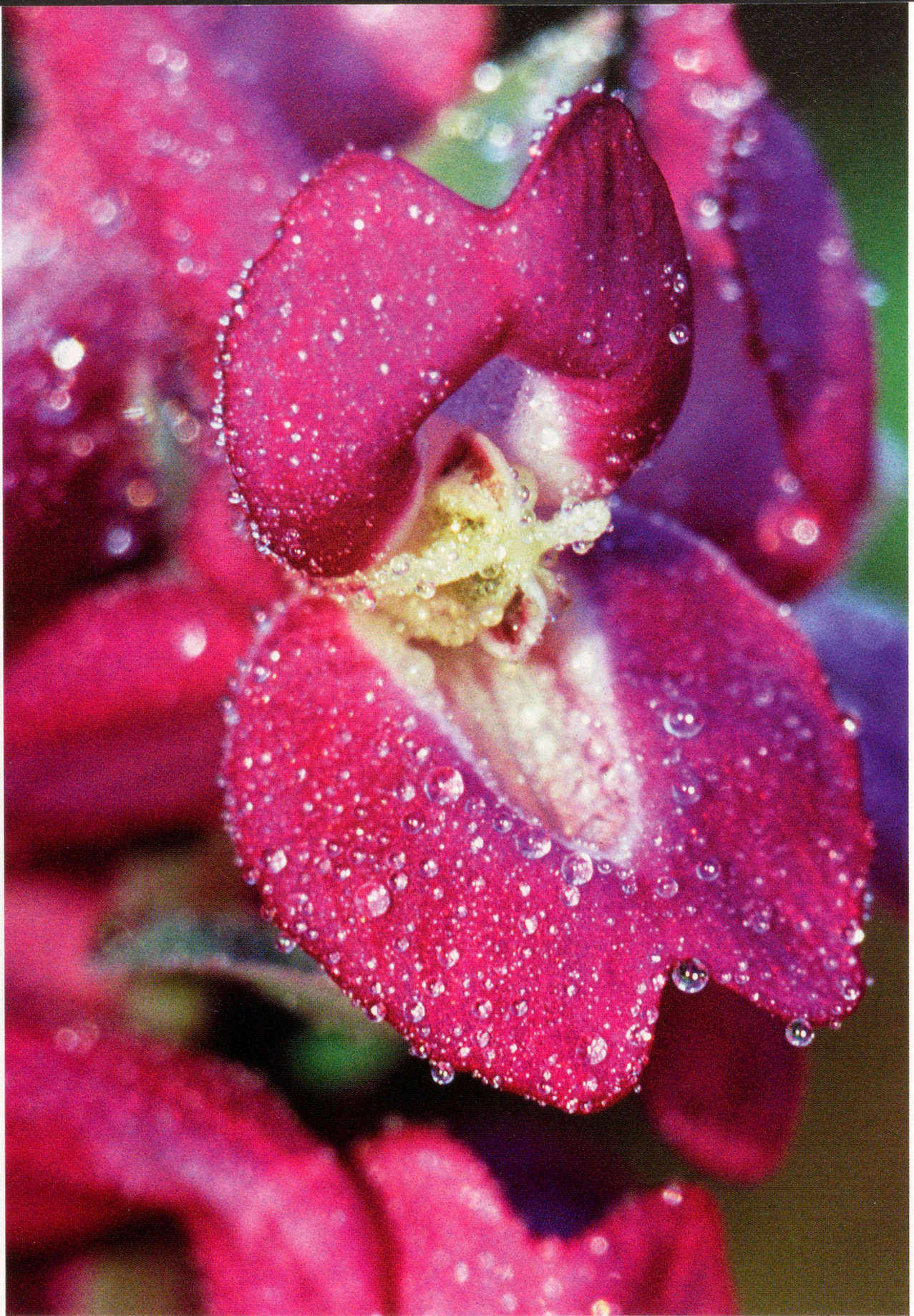
Bild des Monats – Ganz nah: Der hohle Lerchensporn ( Corydalis cava )