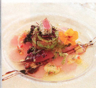
Wie aus dem Gourmetkochbuch – ein Gang aus dem Menu des Tageskurses.

Den richtigen Dreh ... zeigt August Minikus (links). Gemeinsam wird letzte Hand an die kunstvolle Verzierung des Desserts angelegt (rechts).