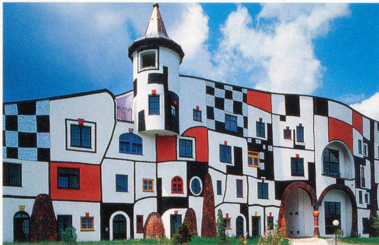
Aussen- wie Innenansichten sind geprägt von natürlich schwingenden Linien. Oben: das Kunsthaus, unten: das gedeckte Bad.