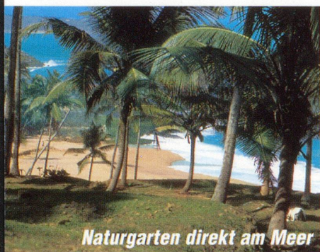
Naturgarten direkt am Meer

Der Erfolg ähnlicher Reisen für die Leser der «Gesundheits-Nachrichten» hat uns bewogen, zwei weitere faszinierende Ayurveda-Reisen durchzuführen. Geniessen und erleben Sie die Wohltaten der Ayurveda!