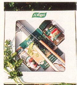
15. – 50. Preis