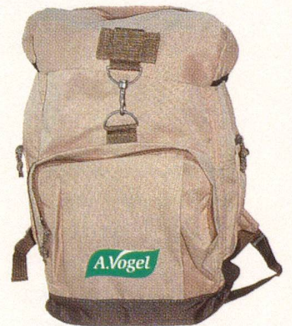
5. – 14. Preis

Einsendeschluss ist der 15. Oktober 2004.