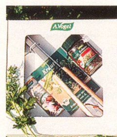
15. – 50. Preis