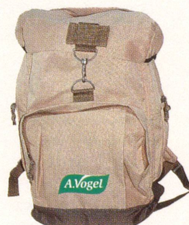
5. – 14. Preis

Einsendeschluss ist der 15. Oktober 2004.