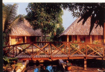
▲ Das Natur-Resort am Mekong