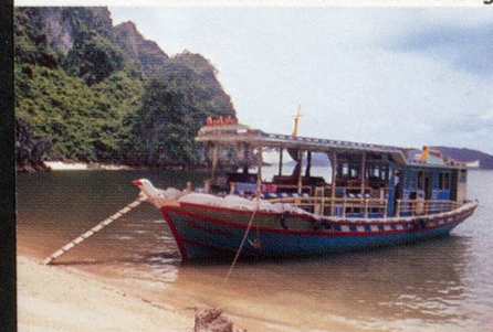
▲ Für unsere Gruppe ein eigenes Boot ▼ In der wunderschönen Halong-Bucht