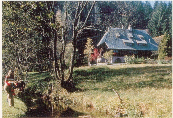
Das Kur- und Feriengebiet Teinachtal im nördlichen Schwarzwald ist ein reizvoller Ausgangspunkt für Wanderungen und Radtouren.

fahrten in den Schwarzwald sind nur ein Teil des reizvollen Programms. Infos und kostenlose Broschüre: Teinachtal-Touristik, Marktplatz 13, D 75387 Neubulach, Tel. D 07053/96 95 10, Internet: www.neubulach.de