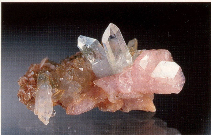
Rosaapatit mit Quarz aus der Lukmanierschlucht