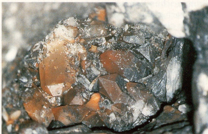
Bergkristallhaufen mit Limonitüberzug in einer Kluft