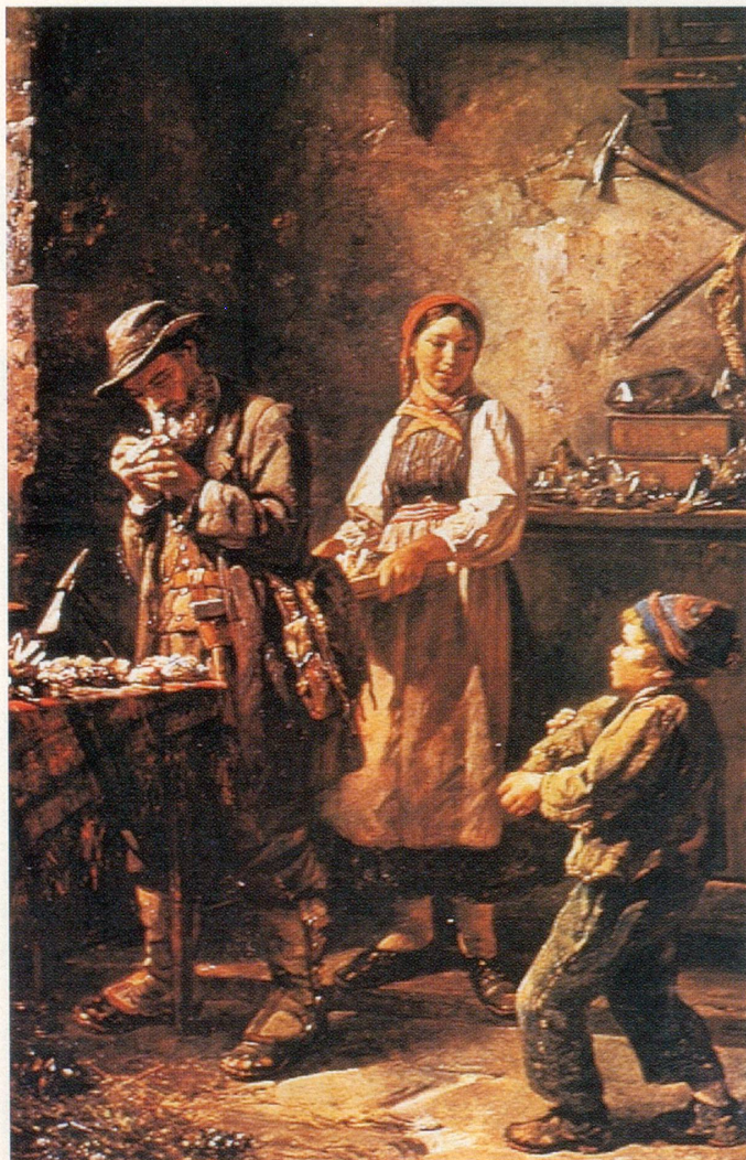
«Der Mineraloge», Ölgemälde von Rafael Hitz. Heimatwerk Zürich

Ganz anders war es mit den wertvollen Mineralien und Edelsteinen. Die besonders begehrten Edelsteine unter den Mineralien sind diejenigen, welche sich durch aussergewöhnliche Klarheit, die Schönheit ihrer Lichtwirkung, die Härte, Dauerhaftigkeit und Seltenheit auszeichnen und damit vor allem für Schmuckzwecke verwenden lassen. Durch Schleifen und Polieren wird zusätzlich eine Formveredlung erreicht, was ihren Wert entscheidend erhöht. Von den mehr als 3000 verschiedenen Mineralien, die es auf der Erde gibt, erfüllen nur wenige Dutzend diese hohen Anforderungen!