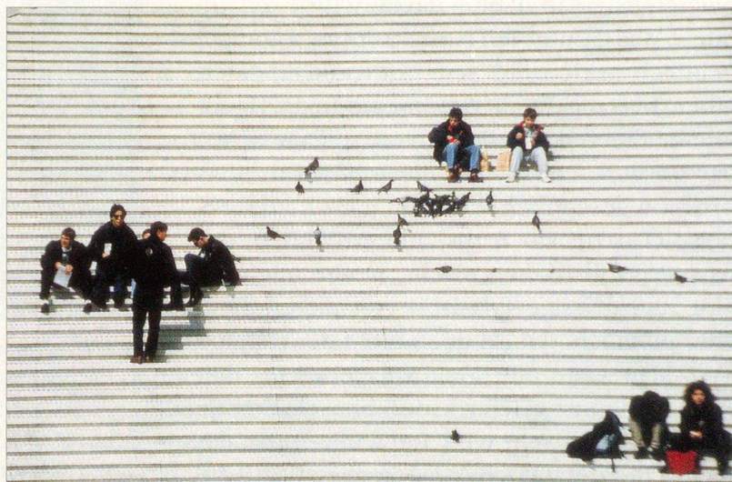
Depressionen erkennen ist schwierig – für Betroffene genauso wie für Aussenstehende.

«Ich sehe eine Depression auch als Chance, an Themen heranzukommen, mit denen man sich sonst nicht beschäftigt.»