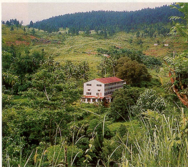
Bio-Teeanbau in Mischkultur (oben). Unten: Blick auf die Teefabrik von Gami Seva Sevana.

Tee aus konventionellem Anbau: Teeplantagen, die als Monokulturen ganze Hügel wie ein englischer Rasen überziehen. Besondere Kennzeichen: Einsatz von Kunstdünger, Intensivbewirtschaftung und damit über kurz oder lang ausgelaugte Böden. Schon optisch ganz anders präsentiert sich das Bild dort, wo nach ökologischen Grundsätzen produziert wird. Statt des endlos gleichen Teeepflanzenteppichs immer wieder schattenspendende Sträucher und Bäume. Der Anbau erfolgt in Mischkultur unter Verwendung von organischem Dünger; auf Insektizide, Fungizide und andere Chemikalien wird verzichtet. Soviel Natur wie möglich, lautet die Devise. Für die Teeinsel Sri Lanka gehört allerdings die konventionelle Teeproduktion noch immer zum Normalfall.