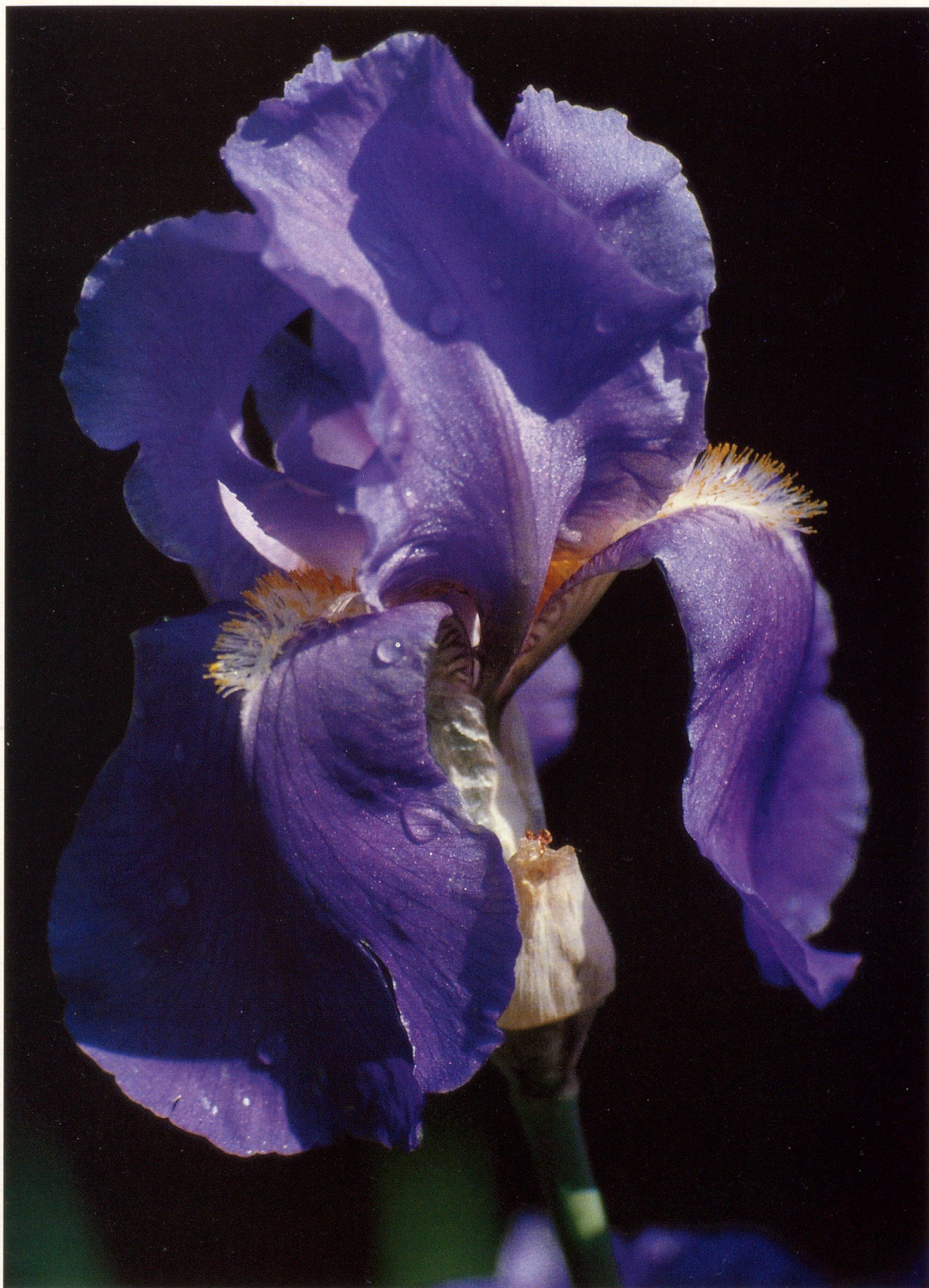
Iris / Schwertlilie